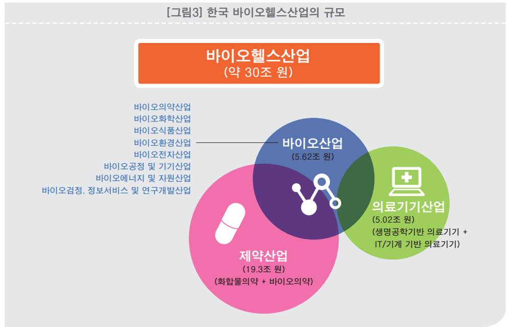
[그림3] 한국 바이오헬스산업의 규모

즉, 한국 경제의 위기를 극복하고 지속적인 성장에 기여하기에는 아직 극히 적은 비중이다. 바이오헬스산업이 앞으로 한국 경제 발전의 핵심 산업이 되기 위해서는 자동차산업 수준인 10% 이상의 경제적 성적을 보여줘야 하며 이를 위해 국내 바이오헬스산업의 전체 시장규모 확대를 위한 방안에 주목하여 할 시점이다.